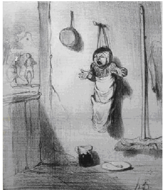
Honoré Daumier: Der zukünftige Erbe (1843)

Der Kindergarten (und seine Vorläufer wie die Kinderbewahranstalt, die Spielschule oder die Kleinkinderschule) war und ist eine Reaktion auf die gesellschaftlichen Bedingungen: Zum einen dient er der Betreuung der Kinder, damit Eltern ihrer Erwerbsarbeit nachgehen können, ohne sich Sorgen um ihre Kinder machen und sie nicht an die Wand nageln zu müssen. Zum anderen hat der Kindergarten die Aufgabe bekommen, die Kinder zu erziehen und zu bilden und sie damit zugleich auf einen gelingenden Schulbesuch vorzubereiten. Umgekehrt hat der Kindergarten nicht nur durch die frühe Bildung, die die Kinder dort erfahren, auf unsere Gesellschaft eingewirkt, sondern in vielfältiger Weise unser Leben durch die Impulse geprägt, die er der modernen Architektur und der bildenden Kunst gegeben hat.